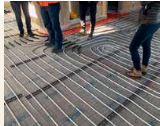
Remplacement complet de la chape, y compris le nouveau chauffage par le sol.

Komplettersatz der Estrichkonstruktion inkl. neuer Fussbodenheizung.