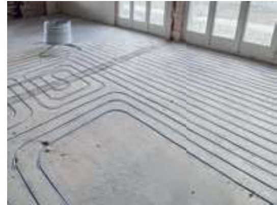
Tubes de chauffage par le sol fraisés ultérieurement dans une chape adhérente existante.

Nachträglich eingefräste Bodenheizungsrohre in einem bestehenden Verbundestrich.