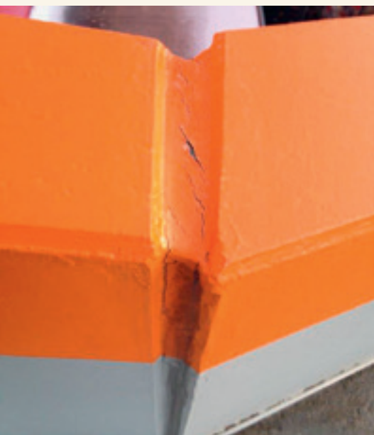
Bewegungsfuge: Rissbildung im Farbsystem. Joint de dilatation: formation de fissures dans le système de peinture.

Verfärbung der Beschichtung auf dem Dichtstoff in Folge Unverträglichkeiten. Changement de couleur du revêtement sur le mastic suite à incompatibilité.