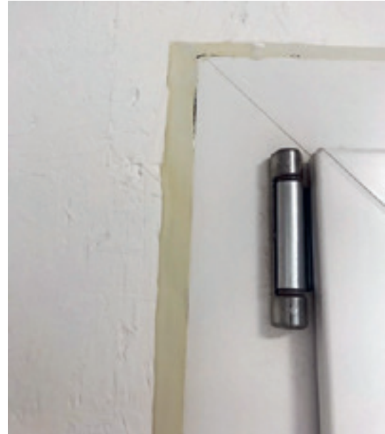
Verfärbungen des Dichtstoffes in Folge Unverträglichkeiten mit der angrenzenden Beschichtung. Changement de couleur du mastic suite à incompatibilité avec le revêtement adjacent.