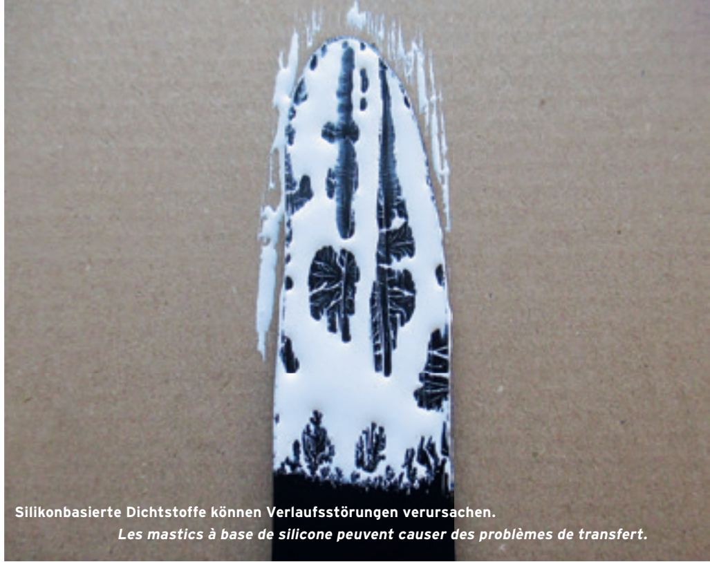
Silikonbasierte Dichtstoffe können Verlaufsstörungen verursachen. Les mastics à base de silicone peuvent causer des problèmes de transfert.