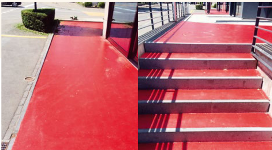
Polyurethanbeschichtung bei der Raiffeisenbank in Tägerwilten

Revêtement en polyuréthane dans la banque Raiffeisen à Tägerwilten