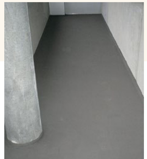
Acryldispersion-Beschichtung in der Binzmühle in Zürich.

Revêtement en dispersion acrylique dans la Binzmühle à Zurich.