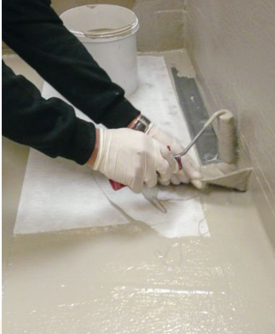
Raccord à la conduite d'écoulement en étanchéité en membranes synthétiques liquides

Durch die Arbeit in einem verbandsübergreifenden Gremium mit Einbezug der Industrie ist es gelungen, einen Entwurf für ein breit abgestütztes Merkblatt zu erarbeiten. Im Moment müssen ein paar Punkte noch eingehender untersucht und Fragen dahin geklärt werden, wie die heute eingesetzten Abdichtungssysteme einzuordnen sind. Voraussichtlich kann der Entwurf in der zweiten Jahreshälfte 2017 in Vernehmlassung gehen. Am PAVIDENSA Boden-Symposium vom 29. März 2017 in Luzern wurde und am PAVIDENSA-Symposium vom 9. Mai 2017 im CAMPUS SURSEE wird die Thematik ebenfalls angeschnitten und damit die Diskussion in eine weitere Runde getragen.