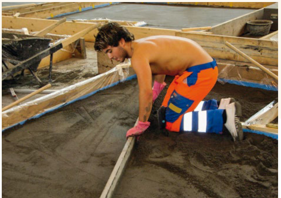
Estrich Einbau in der Lehrhalle in Sursee.

Das erklärte Ziel unseres Fachverbandes ist es, für die Lehrbetriebe eine Plattform für Fragen der Beruflichen Grundbildung zu schaffen. Vorab in der Romandie, wo die Ab- dichter-Lernenden unserer Mitgliederbetrie- be den Hauptteil der Lehrverhältnisse ausma- chen, stehen wir in der Pflicht, eine geeignete Dienstleistung anzubieten. Dies machen wir zusammen mit Gebäudehülle Schweiz, dem anderen im Bereich Abdichter massgeblichen Trägerverband von Polybau.