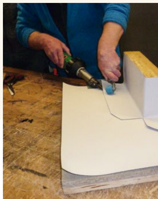
Eckausbildung mit PBD-Abdichtung an der Maquette.

Für die Schule und die überbetrieblichen Kurse üK bestehen festgeschriebene Lehrpläne. Für die betriebliche Ausbildung gibt es dies verständlicherweise nicht. Die betriebliche Ausbildung muss durch den Lehrverantwortlichen je nach Auftragslage im Unternehmen und betrieblichen Gepflogenheiten unter Berücksichtigung der Lehrpläne geplant werden. Was ebenfalls eine Rolle spielen sollte und nicht zu unterschätzen ist, sind die genauen fachtechnischen Inhalte, welche gemäss Lehrmittel vermittelt werden.