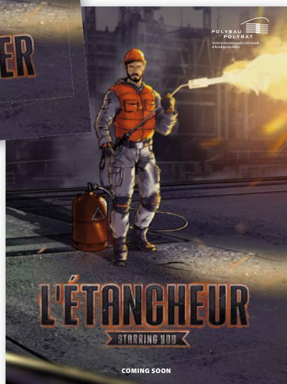
Der Verein Polybau ist der Bildungsanbieter für die Abdichter im Berufsfeld Gebäudehülle. Dieser führt zwei Bildungszentren in Les Paccots bei Châtel-St-Denis und in Uzwil.