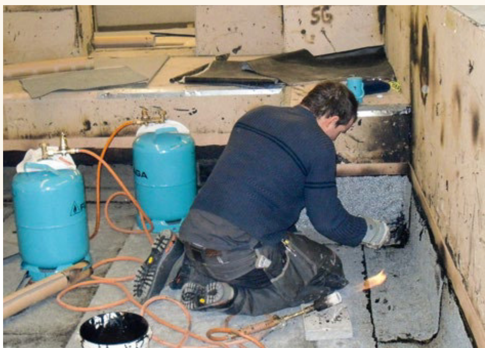
Montage sur maquette d'un angle étanchéifié au polymère bitumineux.

est de créer, pour les entreprises formatrices, une plateforme dédiée aux questions de la formation professionnelle initiale. À commencer par la Suisse romande où les apprenants en étanchéité de nos entreprises membres constituent la majeure partie des contrats d'apprentissage, nous avons l'obligation de proposer une prestation de service adéquate. Nous coopérons à cet effet avec l'autre grande association porteuse de Polybat dans le domaine de l'étanchéité, Enveloppe des édifices Suisse.