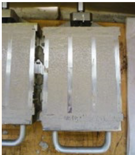
Corps d'essai coulé