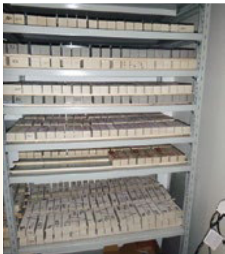
Étendu du premier essai